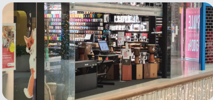
Predaj v roku 2021: Obchody sa zmenili na výdajne. Pri vchode pribudol počítač alebo tablet.

Na vytvorenie elektronického obchodu a prvého produktu budete potrebovať vyplniť niekoľko jednoduchých údajov o sebe a tovare. Ak máte k dispozícii aj fotografie produktov či logo, máte všetko potrebné. Stačí zájsť na novú internetovú službu Oplatisa.sk, ktorú sme práve spustili, a zaregistrovať sa. K dispozícii je prehľadný manuál a po registrácii aj online podpora pre predajcov. Čím viac produktov pridáte, tým viac bude možné u vás nakúpiť online.