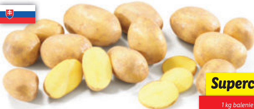
Konzumné zemiaky prílohové • varný typ B • skoré