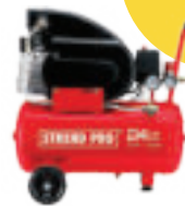
Kompresor 1,5 kW, 24 lit, 1 piestový