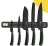
BERLINGERHAUS Emerald, sada nožov