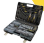
Proteco gola sada 128d.