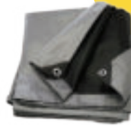
Krycia plachta čierno - stieborná 5X6 M