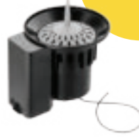
RF dažďový senzor Claber 90831