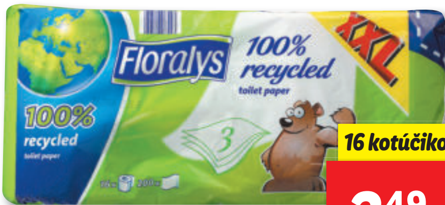
Toaletný papier • 3-vrstvový