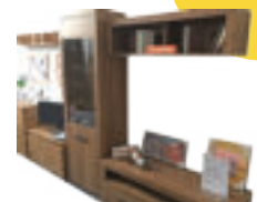
Moderná obývačka VASTO