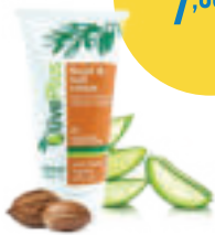
Krém na ruky a nechty s arganovým olejom