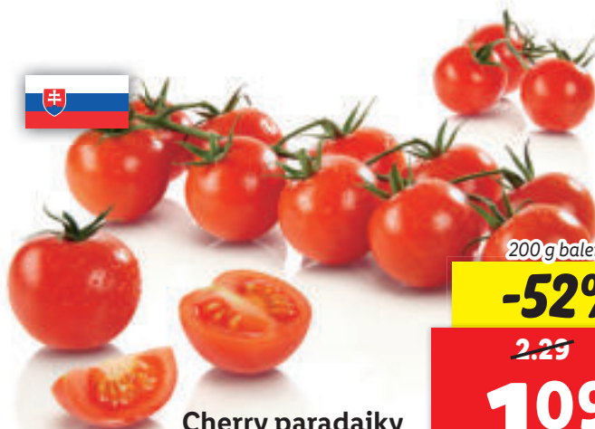
Cherry paradajky strapcové • extra sladké