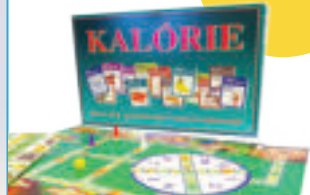
KALÓRIE spoločenská hra