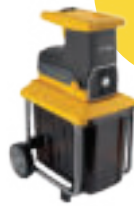
Drvič STIGA BIO SILENT 2500