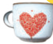
Šálka so srdiečkom