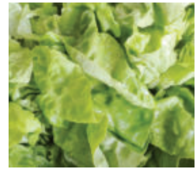
» red Zdroj: Fb RUVZ BA

Vitamín C a betakarotén v šaláte chráni a posilňuje naše cievy, zlepšuje prietok krvi a tým zabráňuje vzniku infarktu. Draslík prítomný v hlávkovom šaláte znižuje krvný tlak a výhodný pomer omega-3 a omega-6 mastných kyselín má priaznivý vplyv na zvyšovanie hladiny HDL cholesterolu („dobrého cholesterolu“) a zároveň na zníženie hladiny LDL („zlého cholesterolu“). Je preukázané, že zelená zelenina znižuje riziko vzniku diabetu 2. typu. Dôvodom je nízky glykemický index, ktorý nespôsobí vysoký nárast hladiny cukru v krvi.