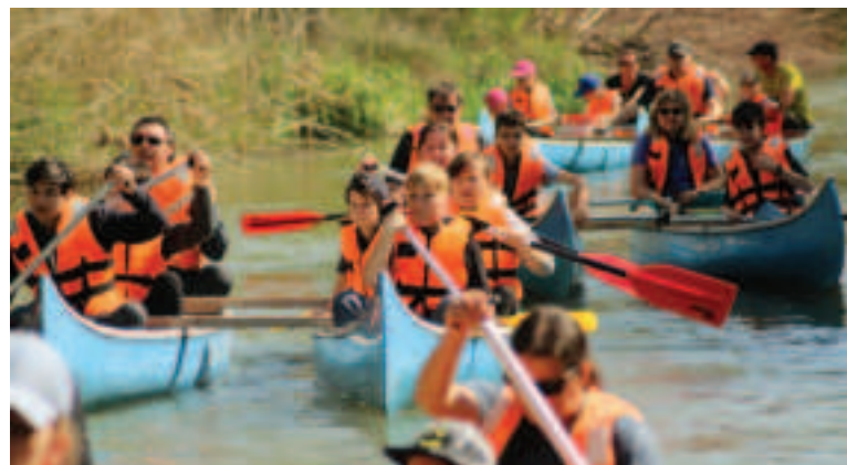
Splavujte rieky trnavského kraja.

Rodiny s deťmi i partie kamarátov v sprievode lokálnych splavovateľov budú mať tak príležitosť objaviť zážitky, ktoré v lete ponúkajú Dunajské ramená, Malý Dunaj alebo Váh. Po netradičných jarných a jesenných splavoch s Vesnou a Svetlonosom prichádza Krajská organizácia cestovného ruchu (KOCR) Trnavský kraj s celodenným vodáckym výletom, ktorého súčasťou bude kúpačka i opekačka. „Po vode v pohode sa môžu vybrať aj ľudia, ktorí splavovať rieku ešte nikdy neskúsili. Vodné toky v našom kraji sú pokojné, o potrebné vybavenie sa postarajú organizátori splavov. Pre účastníkov pripravujú kanoe, pádla i vesty. Všetci absolvujú rýchlokurz. Aj preto si stačí zabalíť iba plavky, opaľovací krém, slnečné okuliare a niečo na