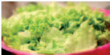
» ren zdrafy foto pexels pixabay

Informácie poskytol Regionálny úrad verejného zdravotníctva Bratislava