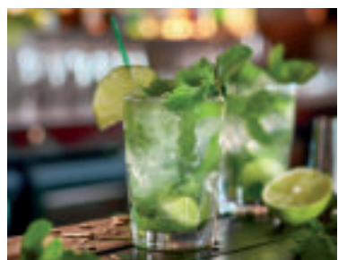
» ren zdroj foto Iffany pixabay

Pozor, neprežeňte to - Mäta nie je vhodná u najmenších detí, ale ani v tehotenstve a pri kojení. U ľudí, ktorí majú ťažkosti s pálením záhy môže vyvolať zhoršenie stavu. Aj v prípade mäty platí, že hoci sú bylinky výborným pomocníkom pri rôznych ochoreniach, užívať by sme ich mali s rozumom a mierou, pretože u každého môžu mať iné účinky a aj ich dlhodobé užívanie nám môže namiesto očakávanej pomoci skôr uškodiť. Ak si nie ste istí, poraďte sa so svojím lekárom.