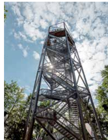
Vyhliadková veža Horné Lazy.

Neďaleko horehronskej obce Polomka nájdete unikátnu rozhľadňu Polomské očko, ktorá ponúka dychberúce výhľady do všetkých svetových strán. Dostať sa na ňu môžete z parkoviska v