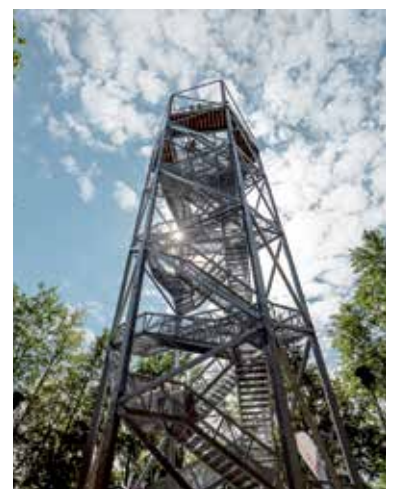
Vyhliadková veža Horné Lazy.

Neďaleko horehronskej obce Polomka nájdete unikátnu rozhľadňu Polomské očko, ktorá ponúka dychberúce výhľady do všetkých svetových strán. Dostať sa na ňu môžete z parkoviska v