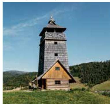
Vyhliadková veža Zbojská.

Na území Národného parku Muránska planina nad sedlom Zbojská medzi obcou Pohronská Polhora a mestom Tisovec môžete navštíviť Vyhliadkovú vežu Zbojská. Vedie k nej lesný chodník s miernym stúpaním cez otvorenú lúku. V jej spodnej časti sa nachádza