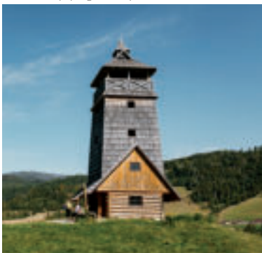
Vyhliadková veža Zbojská.

Na území Národného parku Muránska planina nad sedlom Zbojská medzi obcou Pohronská Polhora a mestom Tisovec môžete navštíviť Vyhliadkovú vežu Zbojská. Vedie k nej lesný chodník s miernym stúpaním cez otvorenú lúku. V jej spodnej časti sa nachádza