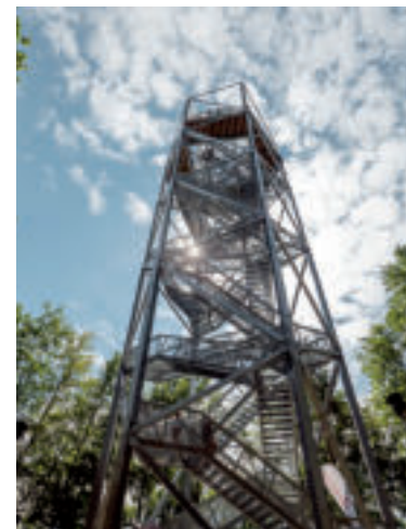
Vyhliadková veža Horné Lazy.

Neďaleko horehronskej obce Polomka nájdete unikátnu rozhľadňu Polomské očko, ktorá ponúka dychberúce výhľady do všetkých svetových strán. Dostať sa na ňu môžete z parkoviska v