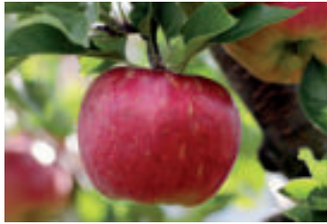
» ren autor foto pixel2013 pixabay

Náš tip: V zimnom období je vhodné chrániť korene niektorých náchylnejších drevín – napríklad aj figovníka, pred prípadným vymrznutím tak, že ich pokryjete nástiolkou z čecíny.