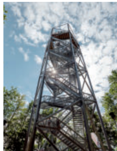
Vyhliadková veža Horné Lazy.

Nedaleko horehronskej obce Polomka nájdete unikátnu rozhľadňu Polomské očko, ktorá ponúka dychberúce výhľady do všetkých svetových strán. Dostať sa na ňu môžete z parkoviska v