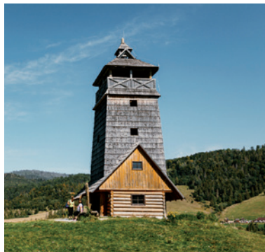
Vyhliadková veža Zbojská.

Na území Národného parku Muránska planina nad sedlom Zbojská medzi obcou Pohronská Polhora a mestom Tisovec môžete navštíviť Vyhliadkovú vežu Zbojská. Vede k nej lesný chodník s miernym stúpaním cez otvorenú lúku. V jej spodnej časti sa nachádza