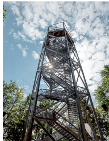
Vyhliadková veža Horné Lazy.

Nedaleko horehronskej obce Polomka nájdete unikátnu rozhľadňu Polomské očko, ktorá ponúka dychberúce výhľady do všetkých svetových strán. Dostať sa na ňu môžete z parkoviska v