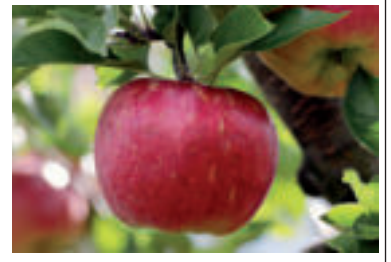
» ren autor foto pixel2013 pixabay

Náš tip: V zimnom období je vhodné chrániť korene niektorých náchylnejších drevín – napríklad aj figovníka, pred prípadným vymrznutím tak, že ich pokryjete nástiolkou z čečiny.