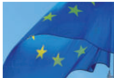
» ren zdroj foto Foto NoName_13 pixabay

Voľby do Európskeho parlamentu sa uskutočnia 8. júna 2024. Voliči v nich rozhodnú o 15 poslancoch, ktorí budú zastupovať Slovensko v EP na päťročné volebné obdobie. Na rozdiel od volieb do Národnej rady SR majú v eurovoľbách právo kandidovať a voliť aj občania iných štátov EÚ s trvalým pobytom na Slovensku. Voliť aj kandidovať však možno len v jednom členskom štáte Európskej únie.