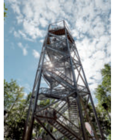
Vyhliadková veža Horné Lazy.

Neďaleko horehronskej obce Polomka nájdete unikátnu rozhľadňu Polomské očko, ktorá ponúka dychberúce výhľady do všetkých svetových strán. Dostať sa na ňu môžete z parkoviska v