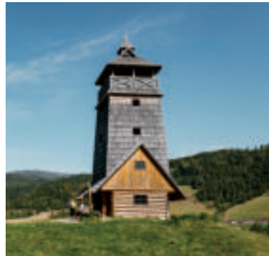
Vyhliadková veža Zbojská.

Na území Národného parku Muránska planina nad sedlom Zbojská medzi obcou Pohronská Polhora a mestom Tisovec môžete navštíviť Vyhliadkovú vežu Zbojská. Vede k nej lesný chodník s miernym stúpaním cez otvorenú lúku. V jej spodnej časti sa nachádza