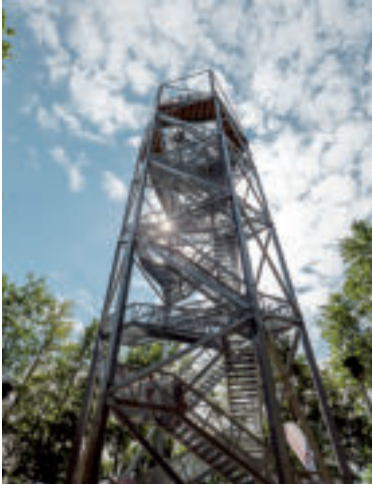
Vyhliadková veža Horné Lazy.

Neďaleko horehronskej obce Polomka nájdete unikátnu rozhľadňu Polomské očko, ktorá ponúka dychberúce výhľady do všetkých svetových strán. Dostať sa na ňu môžete z parkoviska v