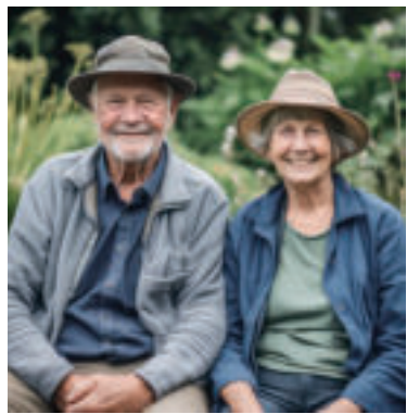
» ren zdroj foto Franz26 pixabay

invalidných, sirotských, vdovských, či vdoveckých dôchodkov, a to vo výške ich priemerných dôchodkov za predchádzajúci rok. V zákone je však takzvaná poisťka, ktorá stanovuje, že 13. dôchodok nesmie klesnúť pod sumu 300 Eur. 13. dôchodok dostanú aj výsluhoví dôchodcovia, teda bývalí príslušníci bezpečnostných zložiek štátu. „Zároveň vláda SR bude môcť nariadením rozhodnúť o skoršom vyplatení časti 13. dôchodku, a to najmä v prípade, ak by sa zhoršila sociálna a ekonomická situácia,“ uzatvára rezort práce.