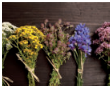
» acn zdroj foto ACN

Modlitbu k Nanebovzatiu nájdete na www.acnslovensko.sk