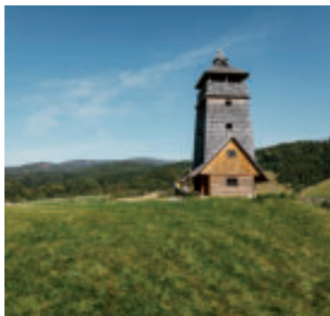
Vyhliadková veža Zbojská.

Na území Národného parku Muránska planina nad sedlom Zbojská medzi obcou Pohronská Polhora a mestom Tisovec môžete navštíviť Vyhliadkovú vežu Zbojská.