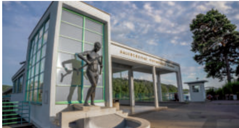
Barlolámač a Kolonádový most.

Nájdete tu archeológiu regiónu Piešťan, nálezy z bohatých kniežacích hrobov z Krakovian-Stráží, národopis regiónu s ľudovým domom s pôvodným zariadením a zbierkami keramiky, ľudových plastík, krojov, obrazov, expozíciu približujúcu dejiny Piešťan a dejiny Piešťanských kúpeľov. Časť expozície je venovaná najvýznamnejším minerálnym vodám Slovenska a samostatná časť expozície je venovaná významnej osobnosti slovenských i európskych dejín – gen. M. R. Štefánikovi. Pri príležitosti stého výročia narodenia slovenského básnika Ivana Krasku Balneologické múzeum slávnostne otvorilo v priestoroch jeho piešťanského bytu expozíciu Pamätná izba Ivana Krasku.