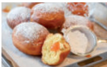
» ren zdroj foto RitaE pixabay

Vyprážené šišky necháme odkvapkávať od prebytočného tuku na papierových obrúskoch a potom posypeme práškovým cukrom.