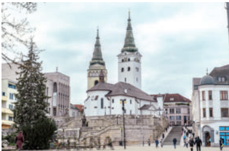
Katedrála na námestí Andreja Hlinku.

Žilina je významnou dopravnou križovatkou, v ktorej sa stretávajú trasy medzinárodného významu spájajúce Slovensko s Českom a Poľskom. V meste sa stretajú aj hlavné slovenské železničné trate, ktoré sú súčasťou postupne modernizovaného Paneurópskeho dopravného koridoru.