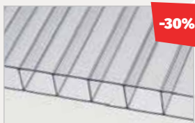
Ultralight 2/10 číra 9,74 €/m 2 s DPH