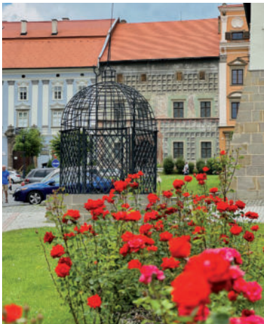
Klietka hanby.

ského mesta. Nájdeme tam silné opevnenie, priestrané pravouhlé námestie ako centrum verejného života s významným farským kostolom a radnicou vo svojom strede a mnohými reprezentačnými meštianskymi domami s vnútornými dvormi a arkádami po obvode námestia Majstra Pavla. Kostoly a veľká časť mesta si zachovali svoj pôvodný ráz. Vzhľadom na výnimočné historické a kultúrne hodnoty bolo historické jadro Levoče v roku 1950 vyhlásené za mestskú pamiatkovú rezerváciu a pre svoje architektonické hodnoty bola Levoča spolu s Dielom Majstra Pavla zapísaná v roku 2009 do Zoznamu svetového kultúrneho dedičstva UNESCO.