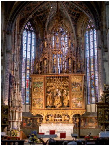
Dielo majstra Pavla - hlavný oltár.

Mesto Levoča disponuje všetkými mestskými atribútmi slobodného kráľov-