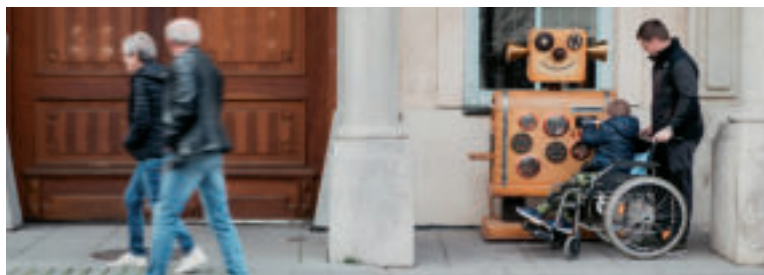
Dobrostroj zbiera nápady na dobré skutky.