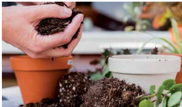
Je čas presádzať a množiť izbové rastliny.

Zo stonky pôvodnej rastliny odrežeme časť tesne pod takzvaným uzlom a vložíme ju do nádoby s vodou, alebo do vlhkého