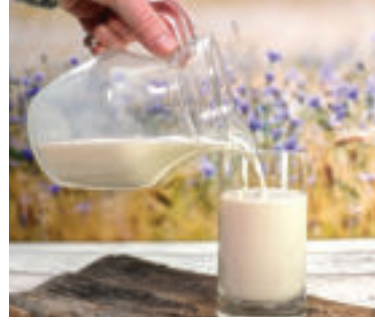
» ren zdroj foto congerdesign pixabay

mlieka, mliečnych výrobkov z nepasterizovaného mlieka alebo tepelne nespracovaného, respektíve nedostatočne tepelne spracovaného mäsa z infikovaných zvierat, čo je štandardnou požiadavkou, aby sme sa vyhli riziku vzniku ochorenia z potravín. „Nakupujte mäso, mlieko a mliečne výrobky od predajcov, ktorí podliehajú pravidelnej kontrole potravín. Vo všeobecnosti dbajte na dodržiavanie osobnej hygieny, dôkladne si umývajte ruky teplou vodou a mydlom po kontakte so zvieratami a živočíšnymi produktmi. Dôsledne dodržiavajte pokyny a odporúčania štátnych a odborných autorít, ktorých cieľom je ochrana verejného zdravia obyvateľov Slovenskej republiky,“ doplnili odborníci.