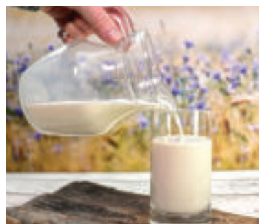
» ren zdroj foto congerdesign pixabay

mlieka, mliečnych výrobkov z nepasterizovaného mlieka alebo tepelne nespracovaného, respektíve nedostatočne tepelne spracovaného mäsa z infikovaných zvierat, čo je štandardnou požiadavkou, aby sme sa vyhli riziku vzniku ochorenia z potravín. „Nakupujte mäso, mlieko a mliečne výrobky od predajcov, ktorí podliehajú pravidelnej kontrole potravín. Vo všeobecnosti dbajte na dodržiavanie osobnej hygieny, dôkladne si umývajte ruky teplou vodou a mydlom po kontakte so zvieratami a živočíšnymi produktmi. Dôsledne dodržiavajte pokyny a odporúčania štátnych a odborných autorít, ktorých cieľom je ochrana verejného zdravia obyvateľov Slovenskej republiky,“ doplnili odborníci.