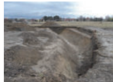
Jeden zo skúmaných úsekov protitankovej priekopy.

Na okraji priekopy boli priamo do jej steny vykopané dva okopy, vzdialené od seba skoro osem metrov. Dimenzované boli len pre jedného strelca. „Vojaci sa mohli po dne priekopy rozmiešťať do a zo streleckých pozícií tak ako v zákopoch alebo v bastiónových opevneniach v krytých cestách (fr. Chemin couvert). V každom z okopov sa našlo 9 nábojnic 7,92 × 57 mm Mauser. Výrazná korózia umožnila bližšie určiť len jednu. Vyrobená bola v Berlíne v roku 1938. Vzhľadom na ich počet by mohli pochádzať buď z nemeckej pušky Karabiner 98k, ktorá mala štandardne pásku na 5 nábojov, alebo z nemeckých pušiek Gewehr 41 alebo 43, ktoré mali zásobník na 10 nábojov. Keďže pásky, ktoré sa po spotrebovaní nábojov zvyčajne vyhadzovali, sa v okopoch a v ich okolí nenašli, nábojnice pochádzajú skôr z pušiek so zásobníkmi. Sondáž zákopy, ktoré sa kopali pred i za priekopami, nezachytila.