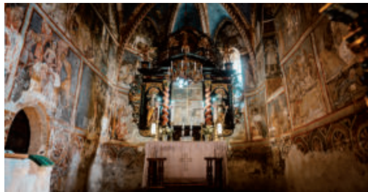
Evanjelický kostol v Ochtinej - interiér.