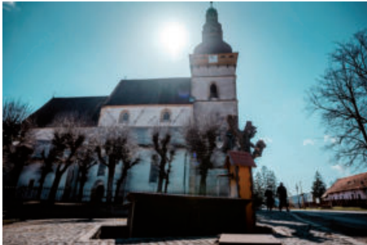
Kostol Evanjelickej cirkvi A.V. v Štítniku.

V projekte podporenom grantovým programom Terra Incognita vznikli štyri hry, ktoré umožňujú hráčom prostredníctvom smartfónu objavovať známe gemerské gotické kostolíky. Projekt vychádza z populárneho geocachingu, avšak táto aktivita je charakterovo akčnejšia a dobrodružnejšia. Hráči plnia rôzne vedomostné a matematické úlohy, získavajú body a spoznávajú históriu a kultúru navštívených miest. V aplikácii Geofun vznikli popri ďalších lokalitách z Ko-