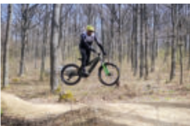
Nový Mine Flow Trail v Rožňave.

Nový Flow Trail je zasadený do malebného dubového lesa v masíve nad Rožňavou a dokonale dopĺňa existujúcu ponuku trail centra MINE TRAILS. Trasa je navrhnutá