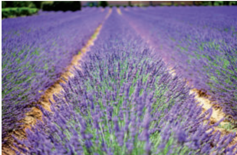
Levanduľa je rastlinka s príjemnou vôňou a s charakteristickými fialovými kvietkami.

V ľudovom liečiteľstve sa využívala levanduľa úzkolistá už od pradávna. Na náš organizmus má táto rastlinka upokojujúce aj dezinfekčné účinky. Pomáha pri dne, reumatizme či zápaloch nervov. Využíva sa aj pri migréne, búšení srdca a pri žalúdočných ťažkostiach.