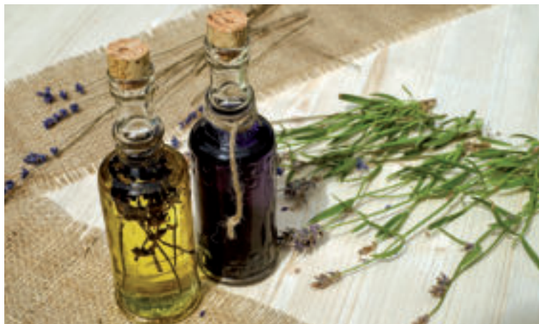
Z levandule si môžeme vyrobiť aj olej.

Hoci sú bylinky výborným pomocníkom pri rôznych ochoreniach, užívať by sme ich mali s rozumom a mierou, pretože u každého môžu mať iné účinky a aj ich dlhodobé užívanie nám môže namiesto očakávanej pomoci skôr uškodiť. Platí to aj v prípade levandule. Čaj či olej z tejto bylinky nepite dlhodobo. Ak si nie ste istí, poraďte sa so svojim lekárom.