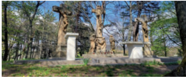
Trstínska kalvária - Golgota.

Kalvária sa tiahne od vstupnej brány umiestnenej v juhovýchodnej časti areálu a lemujú chodník vedúci na vrchol návršia ku kostolu. Naľavo za bránou sa nachádza súsošie Rozlúčka Krista s Máriou a oproti nej výjav Kristus modliaci sa na Olivovej hore. Nasleduje štrnásť zastavení krížovej cesty v podobe stél s reliéfmi jednotlivých výjavov, ktoré sú usporiadané do kruhu okolo šesťfigúrnej skupiny Ukrižovania