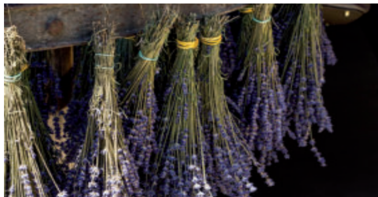
Levanduľu sušte v menších trsoch zavesených na tmavom vzdušnom mieste.