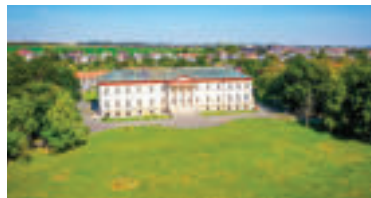
Kaštieľ Dolná Krupá. zdroj foto KOCR Trnavský kraj » ren

Ďalší kyvadlový autobus bude premávať medzi Železničnou stanicou Smolenice a lokalitami, ktoré turisti v tejto obci najčastejšie navštevujú. Smolenická fčela ich odvezie počas všetkých víkendov v júni, júli a v auguste.