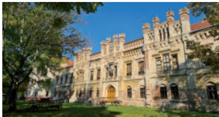
Neogotický kaštieľ v Galante.