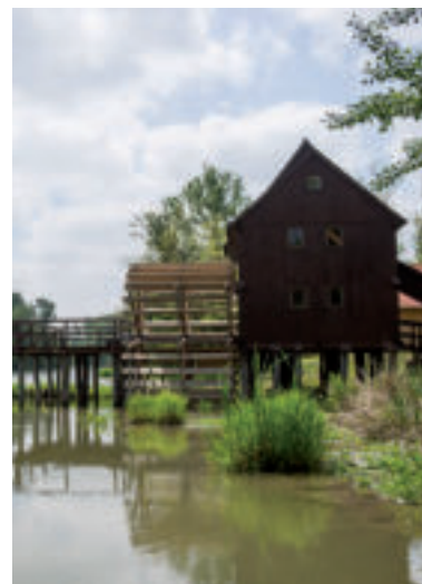
Vodný kolový mlyn Jelka.

ník, od ktorého je potrebné sa vydať smerom na juh po žltej značke. Pri rázcestníku pod Ostrým kameňom pokračujte po červenej - Cesta hrdinov SNP. Po približne 1,5 km mierneho stúpania prídete k zrúcanine hradu, postaveného na vápencovom podlaží západnej časti hrebeňa Zárub.