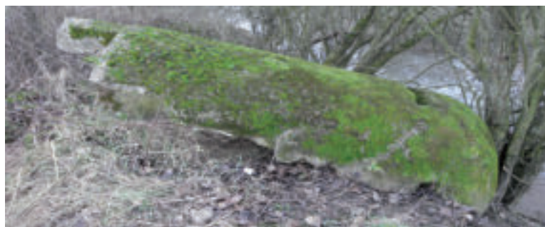
Celkový pohľad na Einmannbunker pred vyzdvihnutím.

Einmannbunkre sa vyrábali prevažne ako železobetónové prefabrikáty vo viacerých betonárňach na území Tretej ríše, ale