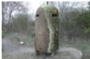
Einmannbunker po vyzdvihnutí z miesta nálezu.

Einmannbunker, celým oficiálnym názvom Luftschutz – Splitterschutzzelle alebo