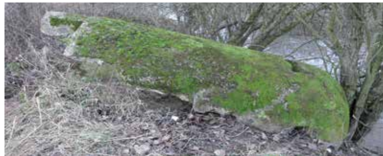
Celkový pohľad na Einmannbunker pred vyzdvihnutím.

Einmannbunkre sa vyrábali prevažne ako železobetónové prefabrikáty vo viacerých betonárňach na území Tretej ríše, ale