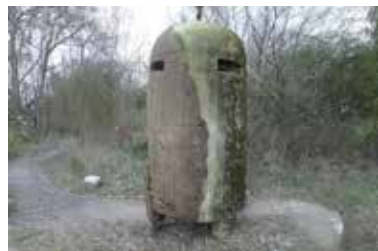
Einmannbunker po vyzdvihnutí z miesta nálezu.

Einmannbunker, celým oficiálnym názvom Luftschutz – Splitterschutzzelle alebo