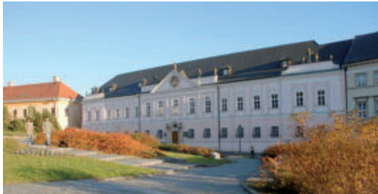
Horné mesto – Veľký seminár.

Ak zavítate do Nitry, určite sa prejdite po pešej zóne. Zdobia ju umelecké diela v duchu veľkomoravských tradícií, či