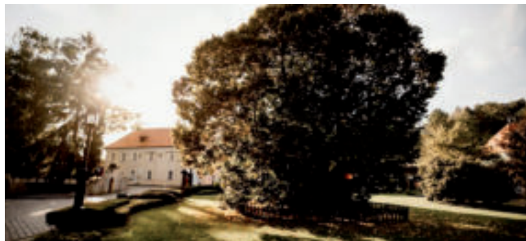
Lipa kráľa Mateja.

Bojnický zámok je jedným z 25 najkrajších európskych hradov a zámkov. Vypína sa na travertínovej kope, ktorú