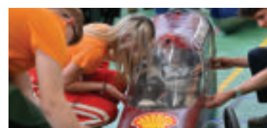
Dopraváci-Prototyp2. zdroj: foto Seesame »

Pretekov sa tento rok zúčastní takmer 119 tímov z 25 krajín Európy a Afriky.