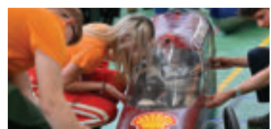
Dopraváci-Prototyp2. zdroj: foto Seesame » ren

Pretekoch sa tento rok zúčastní takmer 119 tímov z 25 krajín Európy a Afriky.