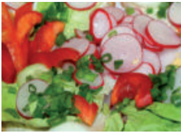
Redkovku môžeme pridávať aj do šalátov.

Redkovka je jednou z najstarších kultúrnych rastlín a vôbec nie je náročná na pestovanie. Najlepšie sa jej darí v mierne vlhkej pôde. Redkovky nie sú len červené malé guľôčky, ako ich poznáme najčastejšie. Existuje viacero druhov, ktoré sa líšia farbou, veľkosťou, chuťou a obdobím pestovania. Zbera sa hlavne koreň, ale aj listy a naklíčené semená, najmä u bielej redkovky.