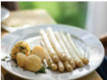
Vhodnou prílohou k špargli sú zemiaky.

Rozlišujeme tri farebné odtiene špargle, ktoré sú výsledkom pôsobenia slnečného svetla. Biela špargľa dozrieva v zemi bez kontaktu so svetlom. Už krátky kontakt so svetlom zafarbí špargľu do fialova a jej chuť sa viac zvýrazní. Ak svetlo pôsobí viac ako dva dni, špargľa sa sfarbí na zeleno a nadobúda ešte intenzívnejšiu a tiež korenistú chuť.