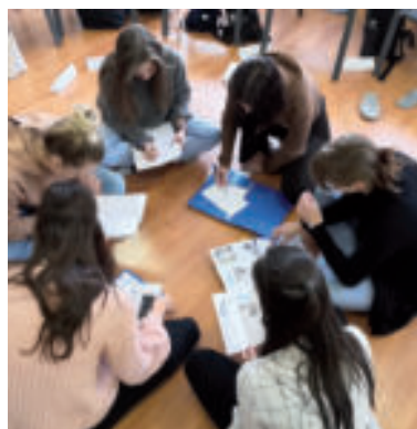
Kruh - poradcovia LDI.