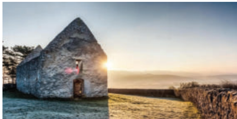
Kostolík - Haluzice.