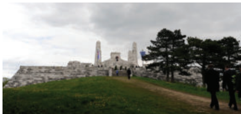
Mohyla generála Milana Rastislava Štefánika.

zrite si najskôr z terasy hotela Elizabeth jedinečný písomný unikát. Je ním rímsky nápis z roku 179 po Kr. vytesaný do hradného brala, ktorý predstavuje jednu z mála rímskych písomných zmienok na sever od Dunaja. A potom už kľukatou kamennou uličkou kráčajte okolo Katovho domu a Fatimy až k hradnej bráne, alebo sa spod mestskej veže s ospievanými Trenčianskymi hodinami na námestí vyberte k hradu po výnimočných krytých Farských schodoch.