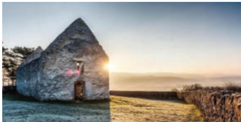
Kostolík - Haluzice.