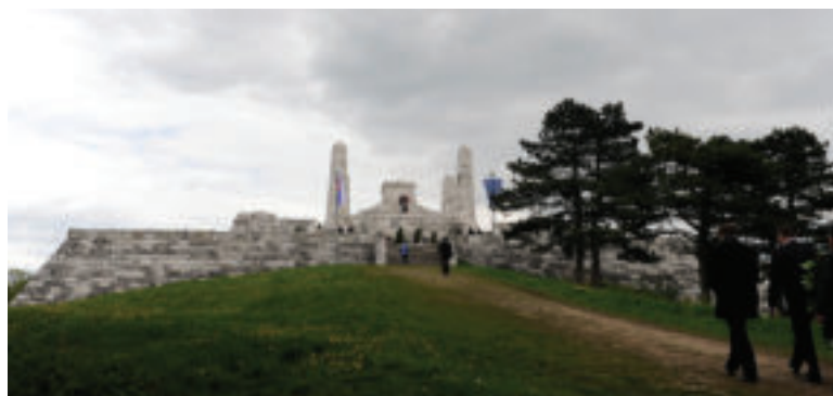
Mohyla generála Milana Rastislava Štefánika.

zrite si najskôr z terasy hotela Elizabeth jedinečný písomný unikát. Je ním rímsky nápis z roku 179 po Kr. vytesaný do hradného brala, ktorý predstavuje jednu z mála rímskych písomných zmienok na sever od Dunaja. A potom už kľukatou kamennou uličkou kráčajte okolo Katovho domu a Fatimy až k hradnej bráne, alebo sa spod mestskej veže s ospievanými Trenčianskymi hodinami na námestí vyberte k hradu po výnimočných krytých Farských schodoch.