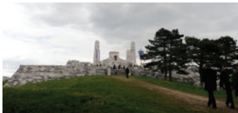
Mohyla generála Milana Rastislava Štefánika.

zrite si najskôr z terasy hotela Elizabeth jedinečný písomný unikát. Je ním rímsky nápis z roku 179 po Kr. vytesaný do hradného brala, ktorý predstavuje jednu z mála rímskych písomných zmienok na sever od Dunaja. A potom už kľukatou kamennou uličkou kráčajte okolo Katovho domu a Fatimy až k hradnej bráne, alebo sa spod mestskej veže s ospievanými Trenčianskymi hodinami na námestí vyberte k hradu po výnimočných krytých Farských schodoch.