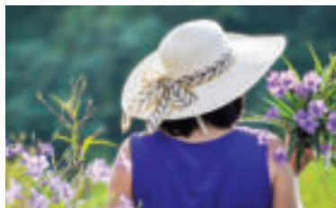
» ren zdroj foto haphamcamera pixabay

• Nikdy nenechávajte deti a zvieratā čakať v zaparkovanom vozidle - ani ak ste presvedčení, že sa vzdialite iba na chvíľu. Nespoliehajte sa na pootvorené okná vozidla, k prehriatiu organizmu dochádza rýchlo a môže mať smrteľné následky.