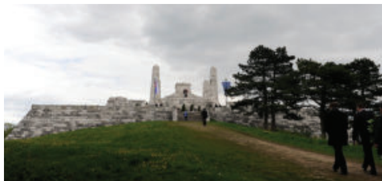
Mohyla generála Milana Rastislava Štefánika.

zrite si najskôr z terasy hotela Elizabeth jedinečný písomný unikát. Je ním rímsky nápis z roku 179 po Kr. vytesaný do hradného brala, ktorý predstavuje jednu z mála rímskych písomných zmienok na sever od Dunaja. A potom už kľukatou kamennou uličkou kráčajte okolo Katovho domu a Fatimy až k hradnej bráne, alebo sa spod mestskej veže s ospievanými Trenčianskymi hodinami na námestí vyberte k hradu po výnimočných krytých Farských schodoch.