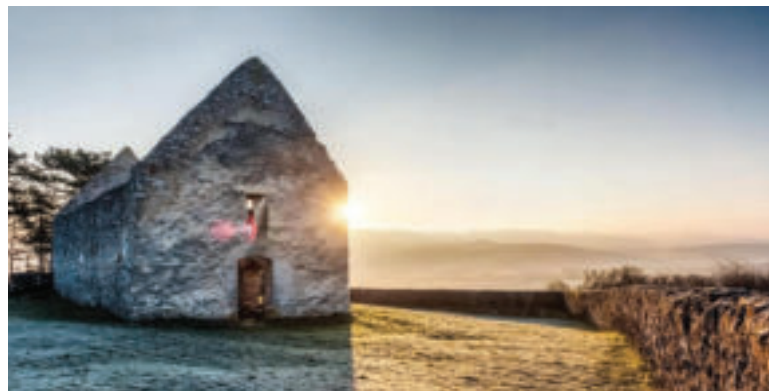
Kostolík - Haluzice.