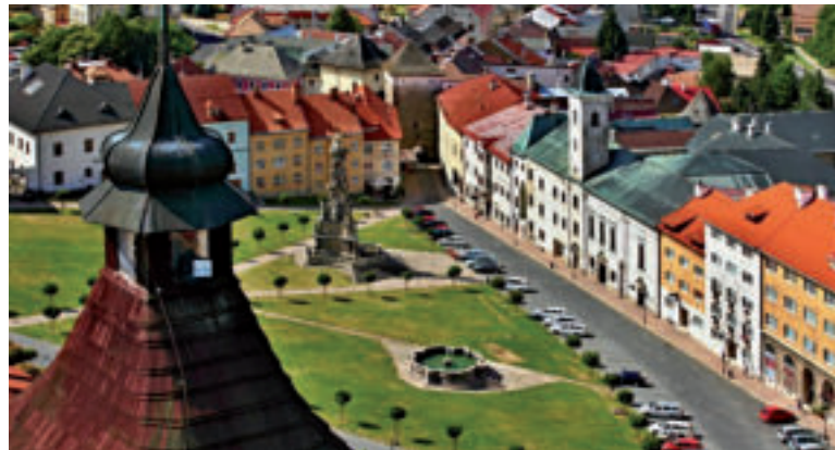
Štefánikovo námestie.

Objekty mincovne v opevnenom meste sú postavené na mieste niekoľkých starších meštianskych domov. Súbor zachovaných výrobných, administratívnych a obytných budov je výsledkom zložitých stavebných premien od 15. stor. podnes. Kremnická mincovňa sa spolu s budin-