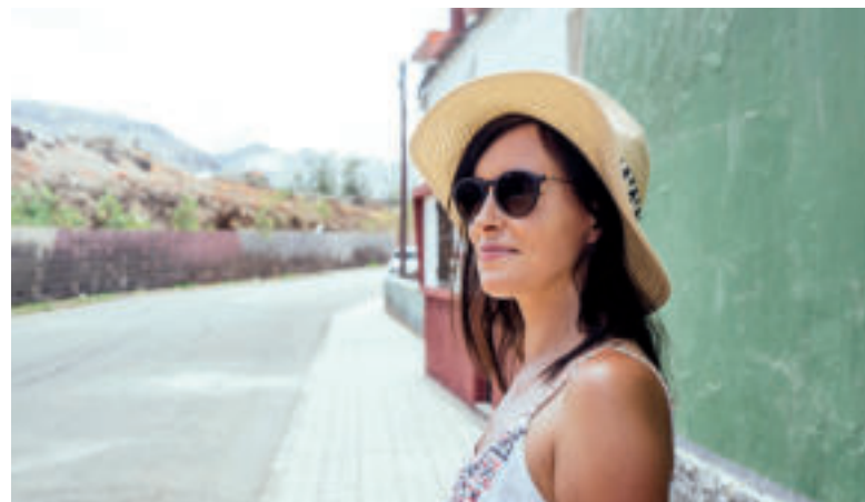
Chráňte sa pred slnkom.

Pribalte si čistú, prípadne minerálnu vodu. Nespoliehajte sa na horské pramene alebo studničky pri turis-