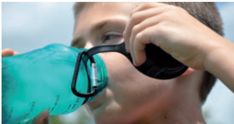
Pribalte si čistú, prípadne minerálnu vodu.