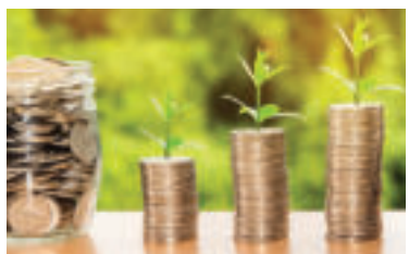
» ren zdroj foto nattananz23 pixabay

Odvodová odpočítateľná položka predstavuje 200 eur za kalendárny mesiac. Ak má brigádujúci študent vymeriavací základ - hrubú mzdu, na základe určenej dohody nižší ako 200 eur za mesiac, odvodová úľava je v sume tohto vymeriavacieho základu. Ak je jeho hrubá mzda nižšia ako 200 eur za mesiac, odvodová úľava je v sume tohto vymeriavacieho základu. Ak je hrubá mzda vyššia ako 200 eur mesačne, odvody mu zamestnávateľ vyráta z rozdielu hrubej mzdy a sumy 200 eur. „Brigádnici môžu zarobiť toľko, na akú sumu sa dohodnú so zamestnávateľom, respektíve viacerými zamestnávateľmi. Sociálna poisťovňa výšku príjmu