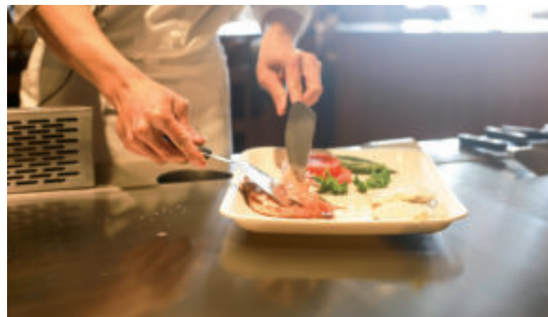
Buďte dôkladní pri varení a ohrievaní pokrmov.

ktoré možno doplniť stravou, vitamín A (respektíve betakarotén - provitamín A), C, E a lykopén.