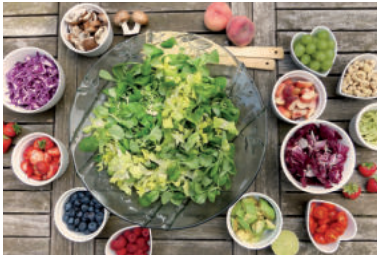
Strava by mala obsahovať dostatok ovocia a zeleniny.

Umývajte a čistite všetky plochy a zariadenia používané na prípravu jedál. Chráňte priestory kuchyne a jedlo pred hmyzom, hlodavcami a inými zvieratami.