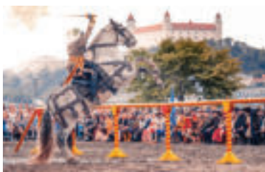
» ren

Pútavý sprievodný program - V rámci sprievodného programu je od piatku až do nedele pripravených niekoľko tematických prehliadok s témou korunovácií a životom Karola III. Jednou z noviniek je sprístupnenie presbytéria Katedrály sv. Martina, kde boli korunovaní uhorskí králi a kráľovské manželky. Jeho súčasťou je i nástenný zoznam tu korunovaných panovníkov. V Starej radnici bude počas korunovačného víkendu vystavená replika uhorskej koruny, ktorou bolo korunovaných viac než 50 uhorských kráľov, vrátane Karola III.