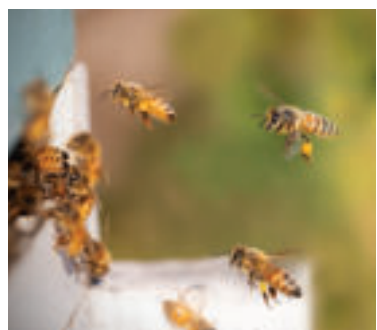
Ilustračné foto.

Pasienkové lesy sú pasienky, na ktorých sú prítomné solitérne stromy a kroviny, nejde o pastvu v hospodárskom lese ani pralesi. Moderne sa takéto usporiadanie označuje ako silvopastorálny systém. Z pohľadu biodiverzity sa jedná o mimoriadne cenné ekosystémy. Vedci dnes upozorňujú na úbytok voľne žijúcich opeľovačov, ktoré sú významné pre rozmnožovanie divo rastúcich aj kultúrnych rastlín. Výsledky výskumu ukazujú, že obnovou pasienkového lesa je možné významne zvýšiť početnosť voľne žijúcich včiel.