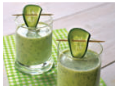
Uhorková polievka nás osvieži.

Výťažky z uhorkiek sa vo veľkej miere používajú na kozmetické účely. Dokážu zjemniť, osviežiť, upokojiť a hydratovať pokožku, zmenšiť póry a celkovo rozjasniť a zlepšiť stav pleti. Vďaka obsahu polysacharidov vytvárajú tieto extrakty z uhorky na pokožke „gélovú“ vrstvu - podobne ako aloe vera, a tá potom pôsobí ako bariéra a udržuje vlhkosť. Výťažky z uhorkiek sú dokonca účinné aj na slnkom spálenú pokožku a taktiež ak potrebujeme zredukovať kruhy pod očami.