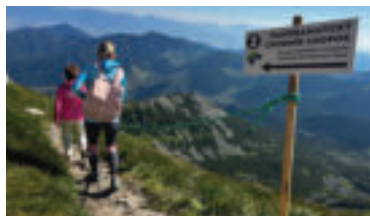
» ren zdroj foto REGION LIPTOV

ani pohľad do zákulisia moderných lanových technológií. Svoje miesto má aj vzdelávacia tabuľa o význame ochrany prírody a zodpovednom pohybe v Národnom parku Nízke Tatry. Veľkým lákadlom aj symbolom projektu je stôl dvoch regiónov. Oddychová zóna, kde sa symbolicky stretáva Liptov a Horehronie – ideálne miesto na výhľady a dokonca aj na piknik. Pri návštevách hôr vždy treba myslieť na predpoveď počasia. Informácie o horskom podnebí a extrémnych javoch, ktoré formujú tatranskú krajinu sú tiež jednou z tém. Predposledným miestom náučného chodníka sú zaujímavosti o výstavbe a údržbe trás v náročnom horskom teréne. Hitom sa už v deň otvorenia stala hojdačka s výhľadom. Je v tvare vtáčieho hniezda a ponúka tie najkrajšie výhľady na Nízke Tatry. Panoramatický chodník odhaľuje jeho návštevníkom aj minulosť. A to napríklad, že za výstavbou chodníkov na Chopok stáli v minulom storočí najmä študenti. „Celé to začalo v roku 1967. O vtedajšiu výstavbu chodníkov v Nízkych Tatrách sa postarali vysokoškóľáci, ktorých volali „chodníkári“.