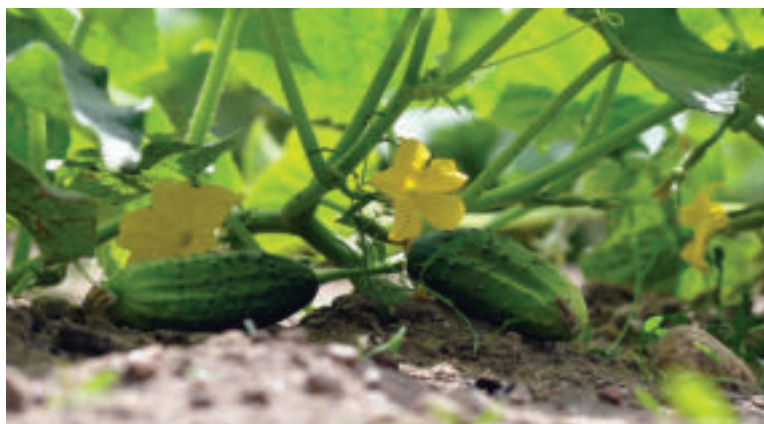
Uhorky nám dodajú vitamíny.

Výťažky z uhoriek sa vo veľkej miere používajú na kozmetické účely. Dokážu zjemniť, osviežiť, upokojiť a hydratovať pokožku, zmenšiť póry a celkovo rozjasniť a zlepšiť stav pleti. Vďaka obsahu polysacharidov vytvárajú tieto extrakty z uhorky na pokožke „gélóvu“ vrstvu - podobne ako aloe vera, a tá potom pôsobí ako bariéra a udržuje vlhkosť. Výťažky z uhoriek sú dokonca účinné aj na slnkom spálenú pokožku a taktiež ak potrebujeme zredukovať kruhy pod očami.