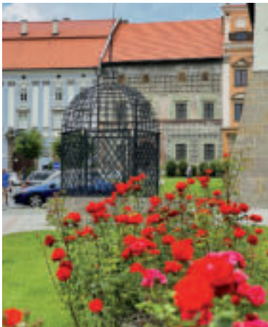
Klietka hanby.

ského mesta. Nájdeme tam silné opevnenie, priestrané pravouhlé námestie ako centrum verejného života s významným farským kostolom a radnicou vo svojom strede a mnohými reprezentačnými meštianskymi domami s vnútornými dvormi a arkádami po obvode námestia Majstra Pavla. Kostoly a veľká časť mesta si zachovali svoj pôvodný ráz. Vzhľadom na výnimočné historické a kultúrne hodnoty bolo historické jadro Levoče v roku 1950 vyhlásené za mestskú pamiatkovú rezerváciu a pre svoje architektonické hodnoty bola Levoča spolu s Dielom Majstra Pavla zapísaná v roku 2009 do Zoznamu svetového kultúrneho dedičstva UNESCO.