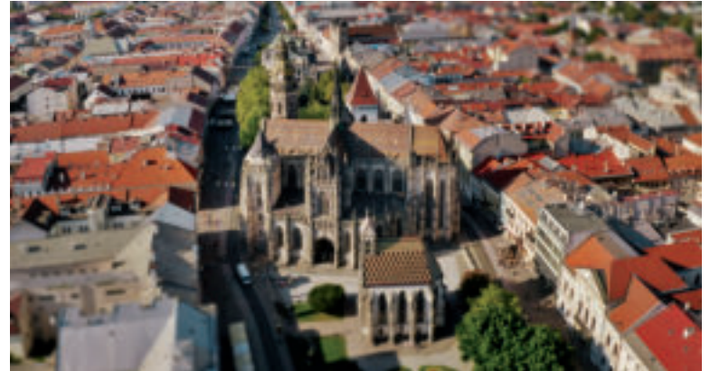
Dóm sv. Alžbety.