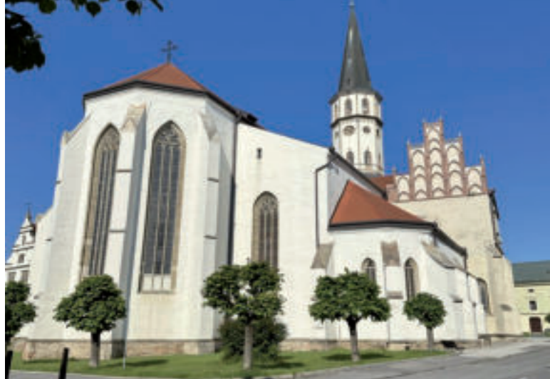
Bazilika sv. Jakuba.

Pôvod levočskej radnice siaha do 15. storočia. Pôvodná drevená budova radnice bola zničená v roku 1550 požiarom, v roku 1599 ju požiar postihol opäť. V roku 1615 ju rozšírili a prístavovali južnú časť a arkády