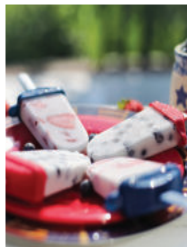
Pripravte si nanuky plné ovocia.