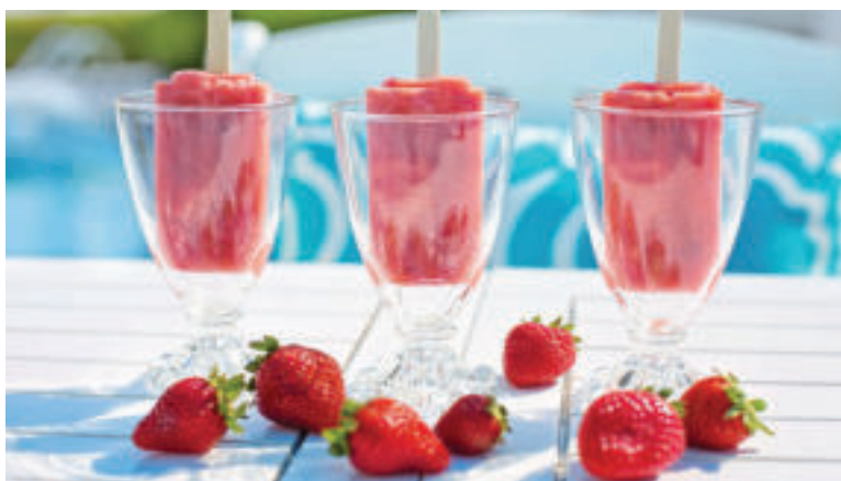
Nanuky sú v lete veľmi obľúbené.

Náš tip: Ak je sorbet určený dospelým, môžete doň tesne pred podávaním prmiešať zopár kvapiek malinového likéru.