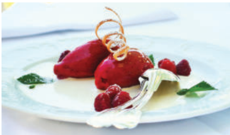
Sorbet výborne osvieži.

Postup: Všetky ingrediencie zmixujeme do hladka, nalejeme do formičiek a uložíme aspoň na tri hodiny do mrazničky.