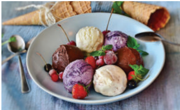
Pripravte si domáce zmrzliny.

Postup: Z vody a kryštálového cukru uvaríme na miernom ohni hustý cukrový sirup a necháme vychladnúť. Potom sirupom zalejeme čučoriedky, pridáme tiež citrónovú šťavu a rozmixujeme ponorným mixérom. Zmes nalejeme do formičiek, teda nádobiek určených na výrobu nanukov a uložíme aspoň na tri hodiny do mrazničky.