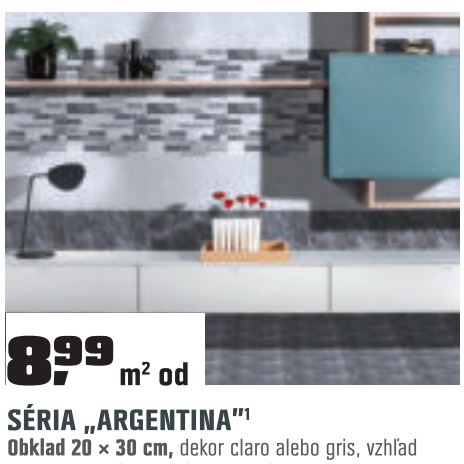
SÉRIA „ARGENTINA“ 1 Obklad 20 × 30 cm, dekor claro alebo gris, vzhľad mramor, lesklý, vhodný do interiéru. Obsah balenia 0,96 m 2 . OBI č. 2713709, 2713725 Dekorácia 20 × 30 cm. Obsah balenia 0,96 m 2 . OBI č. 2713717