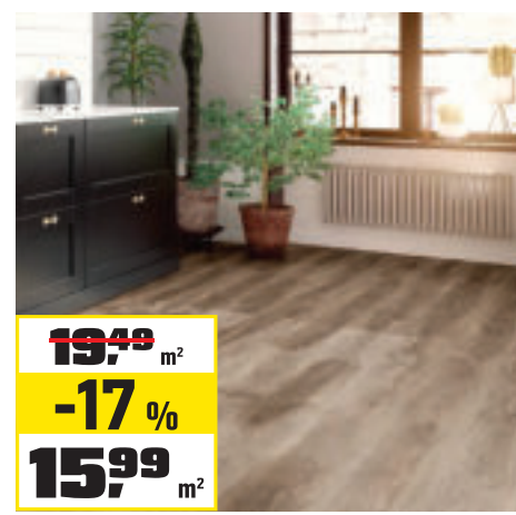
LAMINÁTOVÁ PODLAHA DUB „LUCCA“ 18 × 122 cm, hrúbka 3,5 + 1 mm, s kročajovou izoláciou. Obsah balenia 2,635 m 2 . OBI č. 1670215