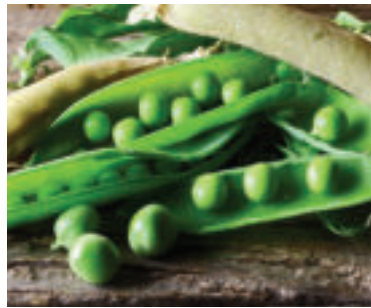
» ren zdroj foto Bluesnap pixabay

Hrach má v našej kuchyni rôznorodé použitie. Vieme si z neho pripraviť chutnú polievku, kašu, prílohu k mäsu, pridávať ho k zapekaným jedlám a jesť aj surový. Najviac výživných látok má však čerstvý mladý hrášok. Ten by mal byť sýtozelený a pri trení jemne vrzgať.