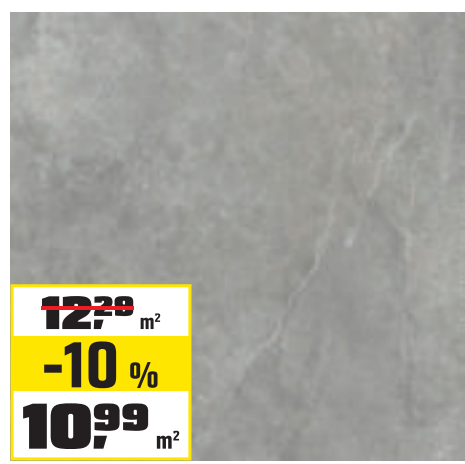
DLAŽBA „SGR54-1“ 60 × 60 cm, hrúbka 8 mm, rektifikovaná, mrazuvzdorná. PEI4, R10. Obsah balenia 1,8 m 2 . OBI č. 2425155