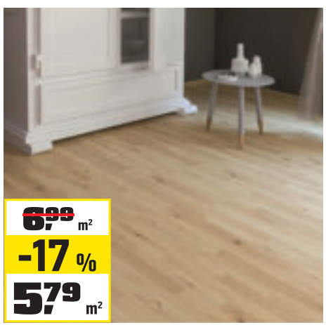
LAMINÁTOVÁ PODLAHA DUB „TREVI“ 1 138 × 19,3 cm, hrúbka 6 mm. Obsah balenia 2,930 m 2 . OBI č. 2732246