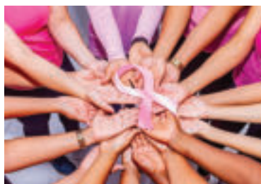
Ilustračné foto. zdroj foto marcojean20 pixabay

Najjednoduchší a najúčinnnejší spôsob, ako si včas všimnúť podozrivé zmeny, je podľa odborníkov samovyšetrenie, ktoré by si ženy mali urobiť aspoň raz mesačne. Ak spozorujú nejakú odchýlku, či zmenu, nemali by zbytočne čakať, ale čo najskôr kontaktovať svojho lekára. » ren