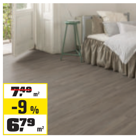
LAMINÁTOVÁ PODLAHA DUB „STONE“ 138,3 × 19,3 cm, hrúbka 8 mm. Obsah balenia 2,402 m 2 . OBI č. 2004026