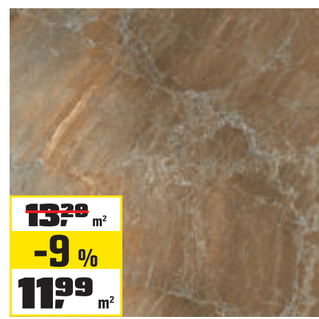
DLAŽBA „DOLOMITI“ 60 × 60 cm, mrazuvzdorná, vhodná aj do exteriéru. PEI3, R9. Obsah balenia 1,08 m 2 . OBI č. 1570829