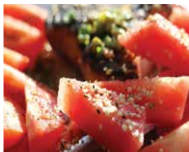
Melón si môžeme pripraviť aj na grile.

Postup prípravy: Melón rozmixujte a pridajte lyžicu bieleho jogurtu. Vznikne tak hydratačná maska pre vašu pleť. Ak chcete maskou doceliť zjemnenie a rozjasnenie pleti, jogurt vymeňte za med.