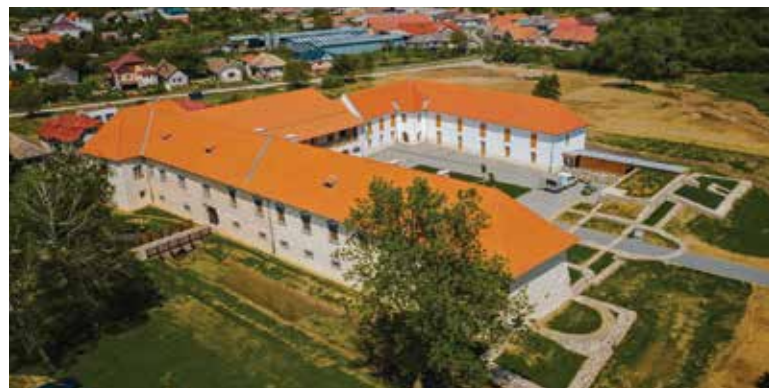
Rákocziho kaštieľ v Borši.

Spišská Kapitula je mestskou pamiatkovou rezerváciou. Niekdajšia samostatná obec je od roku 1948 súčasťou mesta Spišské Podhradie a spolu s ním je zapísaná do svetového dedičstva