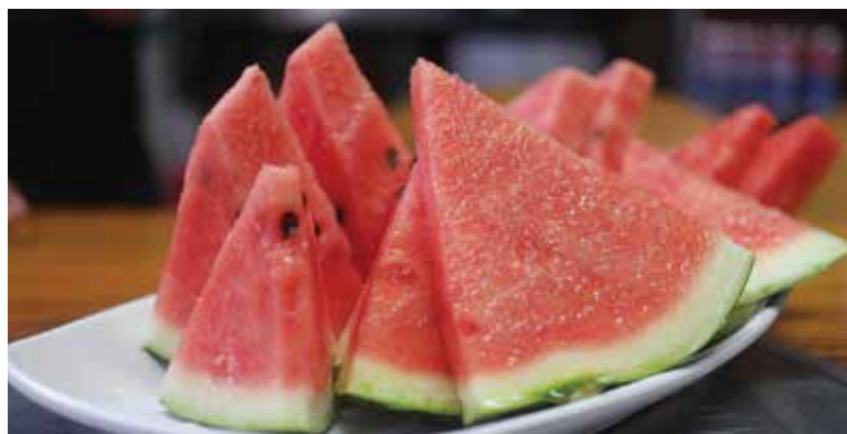
Melón výborne chutí čerstvý, nakrájaný na mesiačky.

koly, 1 balíček syru balkánskeho typu, 500 g cherry paradajok, 1 kus šalotky